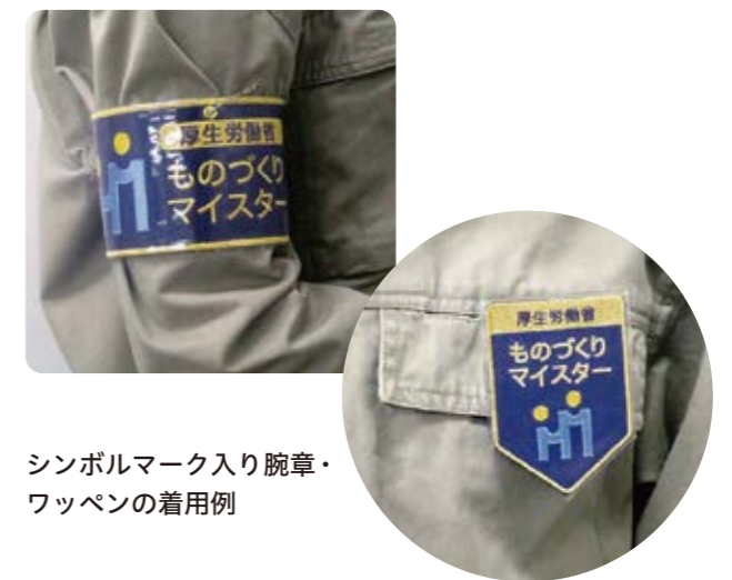
シンボルマーク入り腕章・ワッペンを着用例

ものづくりマイスターの「M」の字をモチーフに、2名の人が居るマークになっています。左側は手を動かし研鑽を積んで成長している若年技能者、右側はマイスターを表しています。