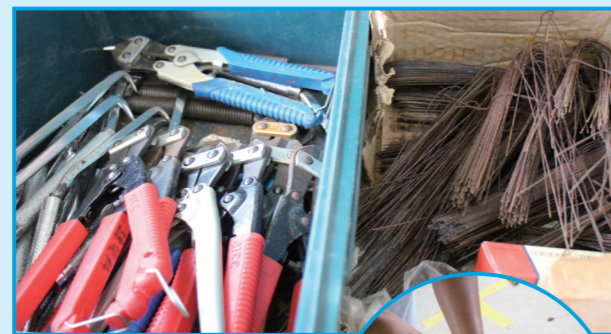
ハッカーなどの道具と結束線

先日も、別の学校でもものづくりマイスターの実践的な指導を検討しているという話を聞きました。この活動の輪が少しずつ広がっていていることを嬉しく思います。