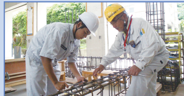
高マイスターの指導の様子

平成28年度から、3級鉄筋施工(鉄筋組立て作業)が、技能検定の職種に加わったことを受け、今後は、検定の受検にも取り組んでいく方針です。